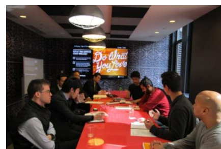
企業訪問風景（米・Fintech/IoT スタートアップ）