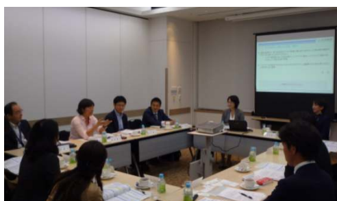
ワークショップ開催風景