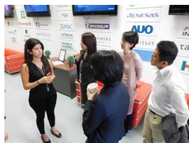
企業訪問風景（米・プラグアンドプレイ・テックセンター）