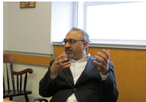
同・MIT訪問風景（サンジェイ・サルマ教授）