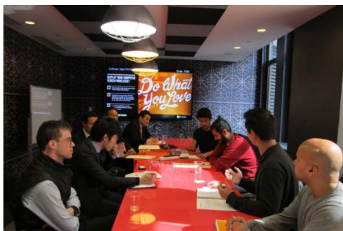
国際IT財団・米国調査2015 現地企業訪問風景

インキュベーション施設の草分け。小売・旅行業スタートアップ企業の支援プログラムがある。