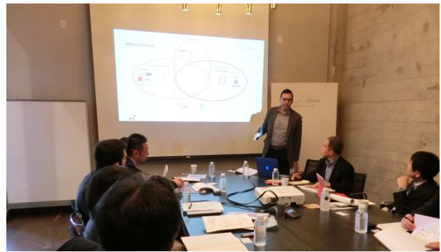
同・現地企業訪問風景