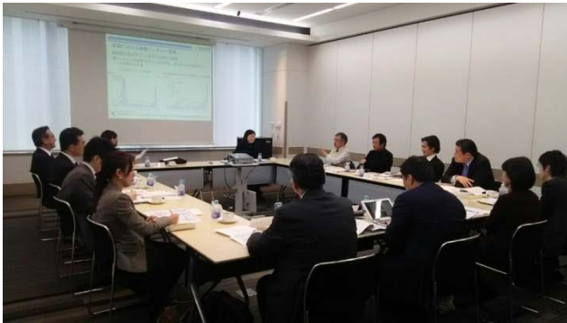
米国調査 2015 事前会合開催風景